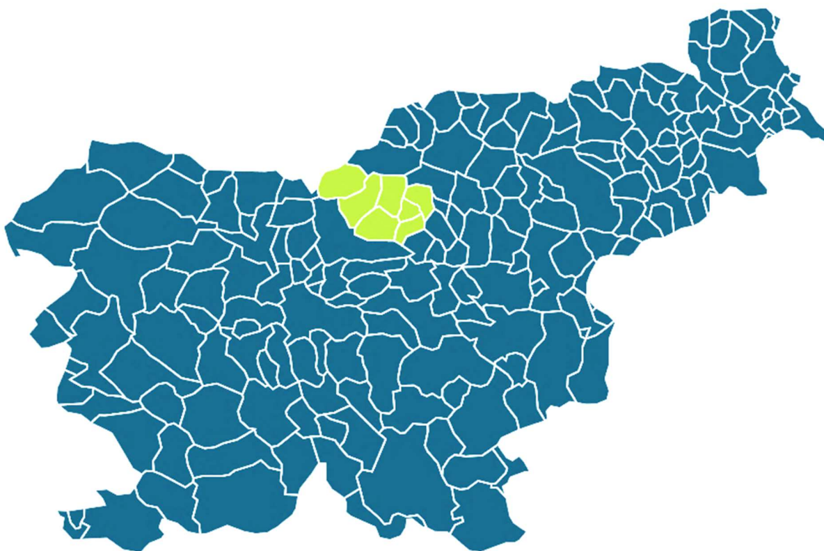
Slika 1: Občine ustanoviteljice